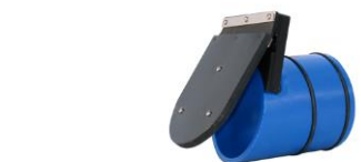
«RIA IKV – Regenwasser»