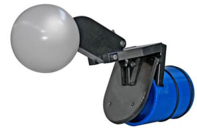
«RIA IKF – mit Schwimmer»