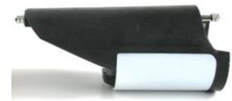
«SSL – Fäkal- und Regenwasser»

Nebst einem umfangreichen Produktsortiment im Bereich von Rückstauklappen (nur im Auslaufbereich einsetzbar), ist bei uns auch eine breite Palette an Absperrschieber erhältlich. Wir von WaterSave stehen für individuelle Beratung und massgeschneiderte Lösungen, welche den Gegebenheiten vor Ort und den Bedürfnissen der Anwender gerecht werden. Neben Analyse und Beratung installieren unsere Fachspezialisten sämtliche Systeme bei Bedarf bei Ihnen vor Ort. Zögern Sie nicht, uns zu kontaktieren!